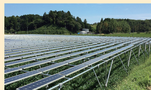
イージーパワーの 厩塚ソーラーシェアリング発電所