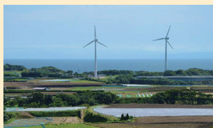
駒井ハルテックの 三浦宮川風力発電所